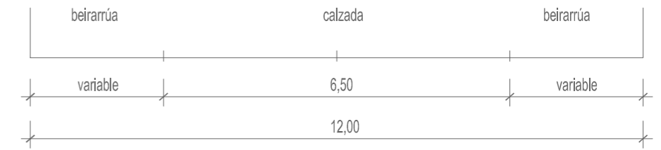
SECCIÓN TIPO NOVO VIAL